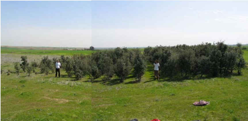
Proyecto “Repoblación forestal con Q. ilex en tierras agrícolas Parcela izquierda: simplemente plantación de Q. ilex Parcela central: pase de desbrozadota en los tres primeros años Parcela derecha: pase de desbrozadota y enterrado de biomasa los tres primeros años